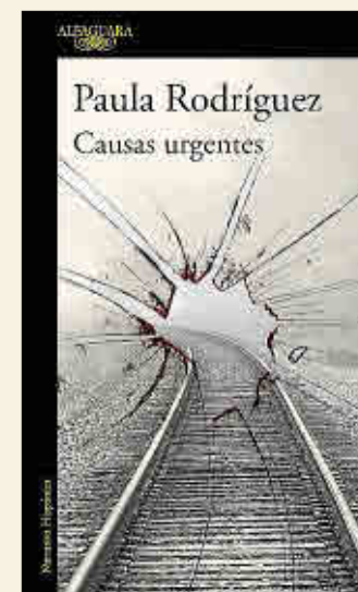
Paula Rodríguez Causas urgentes ALFAGUARA, 2021

❖ Mientras Jane se debate entre hacer lo correcto o dejarse llevar por su deseo hacia Blake, comienza a recibir una serie de cartas firmadas bajo el misterioso seudónimo de Lady Minerva, quien la anima a explorar el alcance de su pasión y los límites de su cuerpo para entender cómo son en realidad las relaciones entre hombres y mujeres, descubriéndole un mundo de sensaciones que nunca pensó que pudiera existir. Para apasionadas de los Bridgerton y enamoradas de la época de Jane Austen.