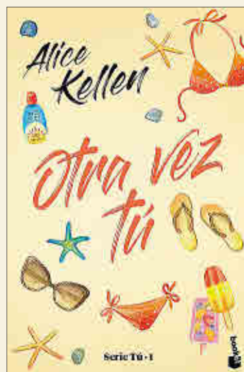
Alice Kellen Otra vez tú BOOKET, 2021

❖ Tras haber desenmascarado al asesino de la quiche letal, la fortuna parece sonreír a Agatha Raisin. Aceptada por la pintoresca comunidad de Carsely, y felizmente acompañada de sus dos gatos, su vida transcurre plácida. Hasta que aparece en escena Paul Bladen, el nuevo veterinario del pueblo, que no se muestra ajeno a sus encantos. Sin embargo, el hombre sucumbe a una inyección destinada a un caballo de carreras y, aunque todo apunta a un accidente, Agatha cree que se trata de un crimen.