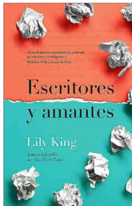
Lily King Escritores y amantes UMBRIEL

El narrador. La primera persona, sincera y emotiva, nos permite acompañar a Casey en su trayectoria vital. Porque Escritores y amantes no es una de esas novelas ahora tan de moda en las que los giros inesperados nos llevan cabalgando sobre un susto tras otro a lo largo de los capítulos. Aquí lo que hace la protagonista es confesarnos al oído sus miedos -muchos y profundos-, sus esperanzas y sus pesares, nos habla de su familia disfuncional, de las perversiones de su padre, nos presenta a sus compañeros de trabajo y a sus jefes, a su mejor amiga y a su hermano.